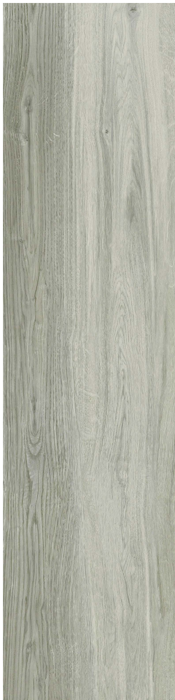
20 x 80 cm (8 x 32) VE.AQ.CIR.0832