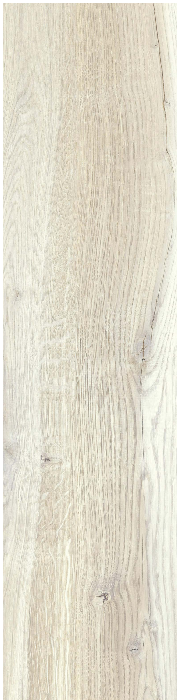
20 x 80 cm (8 x 32) VE.AQ.NIX.0832