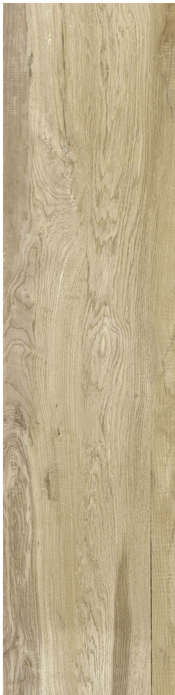
20 x 80 cm (8 x 32) VE.AQ.TUR.0832