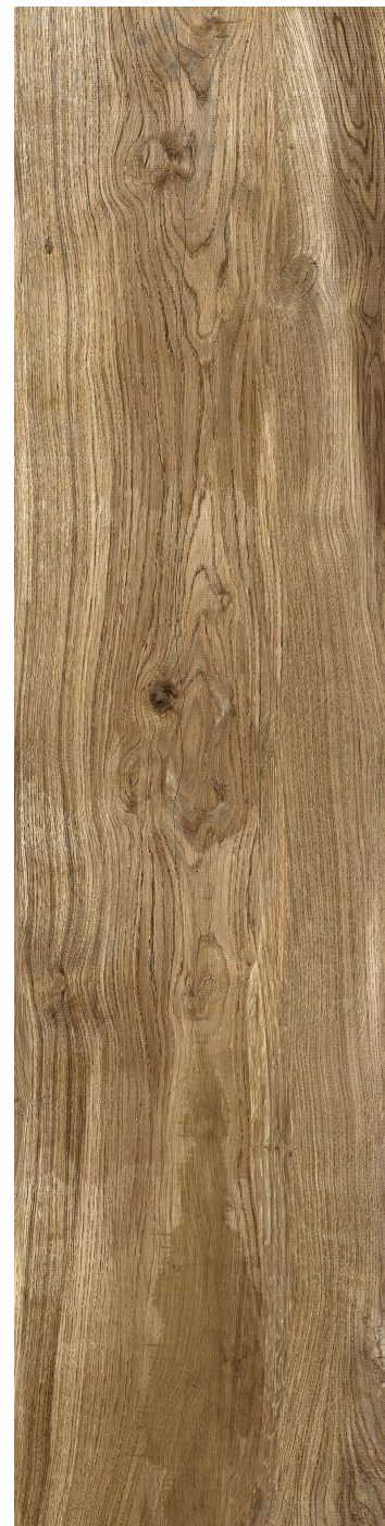
20 x 80 cm (8 x 32) VE.AQ.CAS.0832

Tous les items présentés dans ce document font partie du programme d'inventaire Olympia. Pour les commandes spéciales, veuillez contacter votre représentant de Tuiles Olympia.